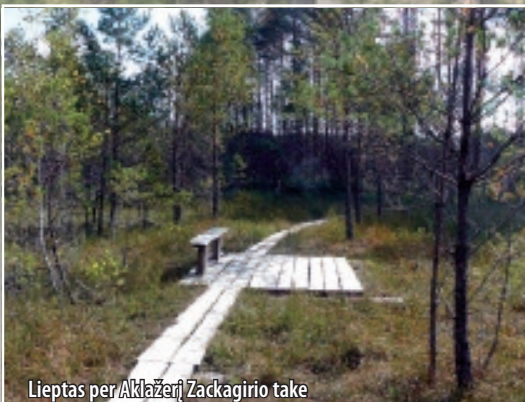
Lieptas per Aklažerį Zackagario take