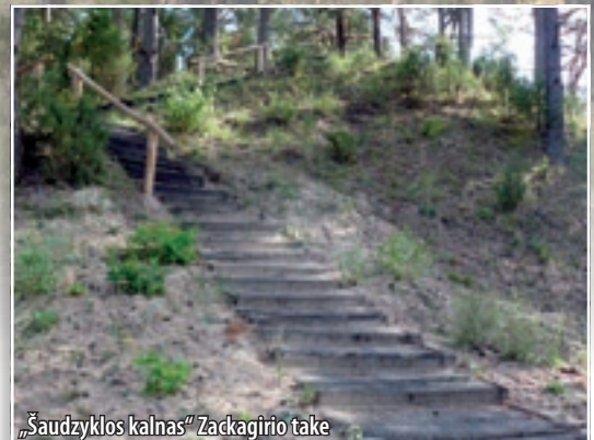
„Šaudyklos kalnas“ Zackagario take