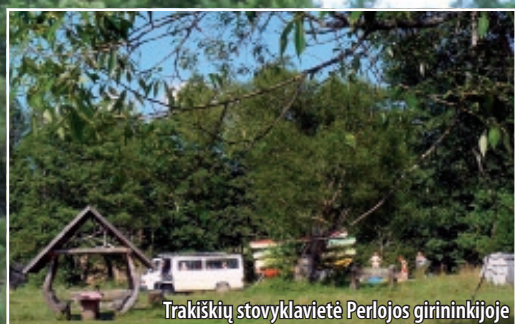
Trakiškių stovyklavietė Perlojos girininkijoje