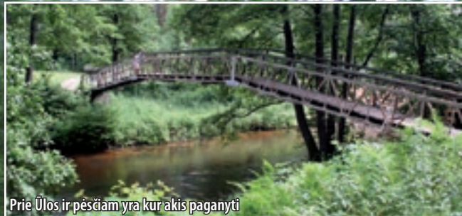
Prie Ūlos ir pėsčiam yra kurakis paganyti