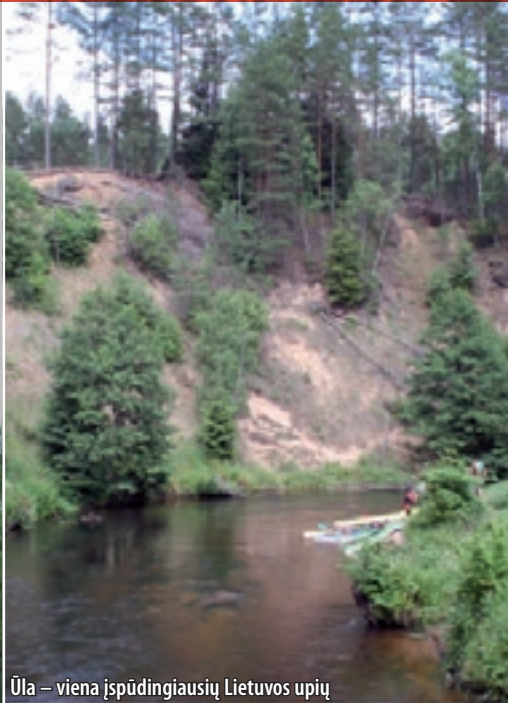
Ūla – viena įspūdingiausių Lietuvos upių