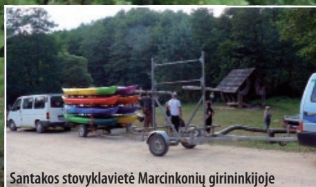
Santakos stovyklavietė Marcinkonių girininkijoje

Pausupės, Mančiagirės, Trakiškių, Mardasavo, Puvočių stovyklavietės, esančios Dzūkijos nacionaliniame parke, yra mokamos. Plaukiantiems baidarėmis Ūlos upe ir apsistojantiems Pausupės, Mančiagirės ir Trakiškių stovyklavietėse mokestis įskaičiuotas į leidimo kainą.