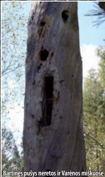
Bartinės pušys neretos ir Varėnos miškuose