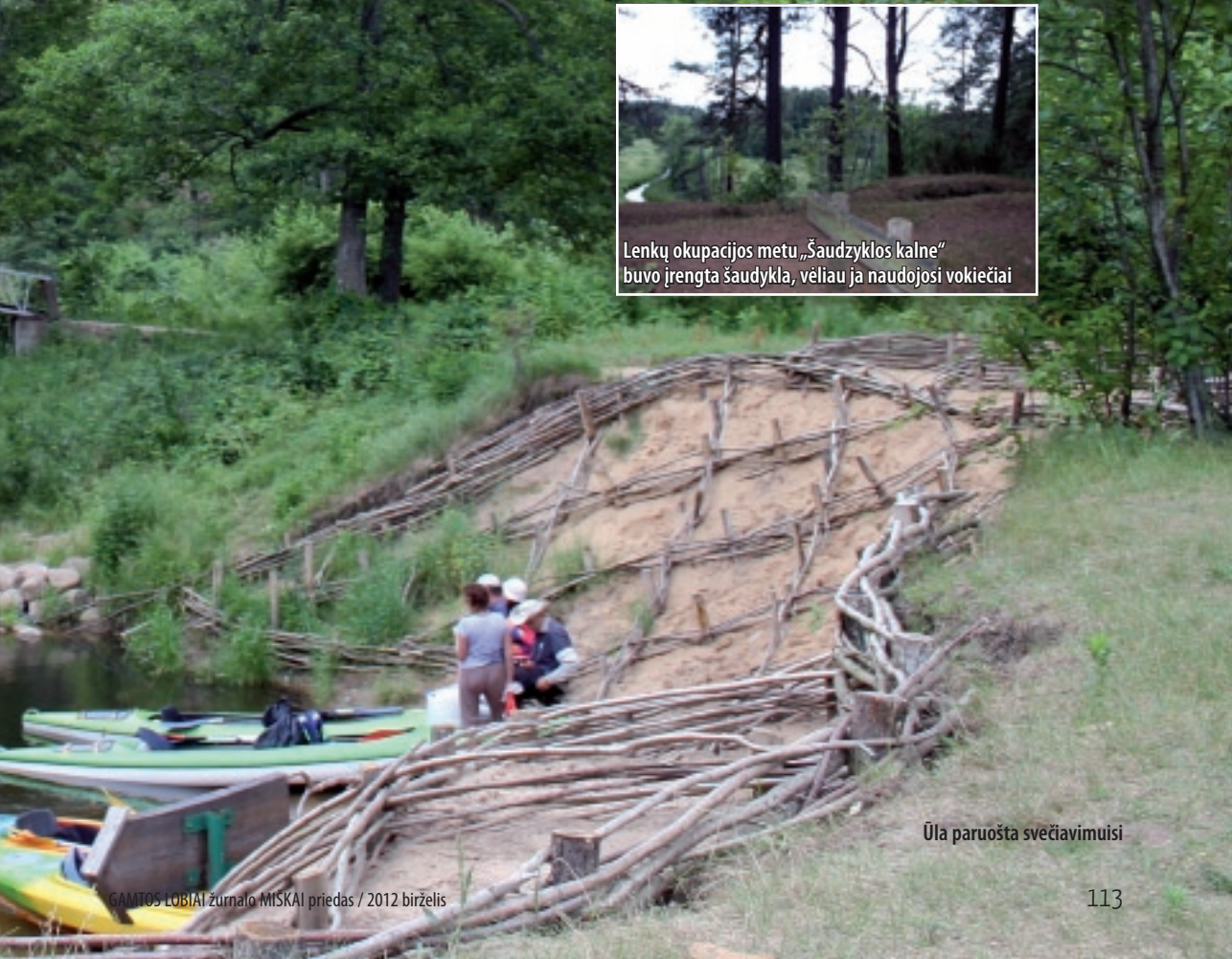
Ūla paruošta svečiamuisi