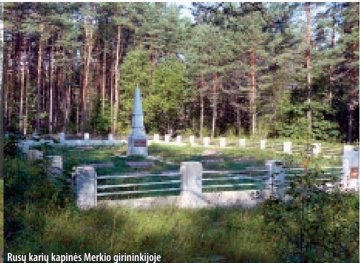
Rusų karių kapinės Merkio girininkijoje