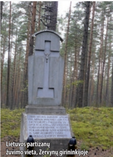
Lietuvos partizanų žuvimo vieta, Zervynų girininkijoje