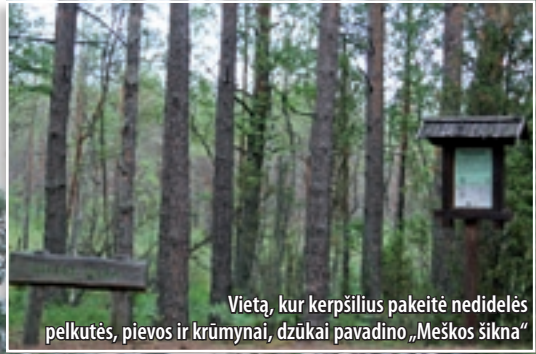
Vieta, kur kerpšilius pakeitė nedidelės pelkutės, pievos ir krūmynai, dzūkai pavadino „Meškos šikna“