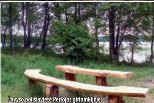
Lavyso poilsiavietė Perlojos girininkijoje

Varėnos miškų urėdijoje yra įrengti 92 laisvalaikio ir rekreacijos objektai. Iš jų 27 yra Dzūkijos nacionaliniame parke. Turbūt pats lankomiausias iš jų – prie Glūko ežero. Aplink šį ežerą plytintys miškai yra valstybiniai. Todėl čia lankytis galima be jokių apribojimų.