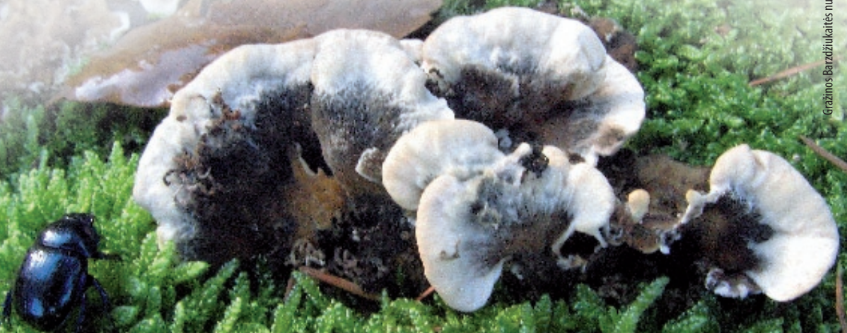
Kiti Dzūkijos šilų gyventojai