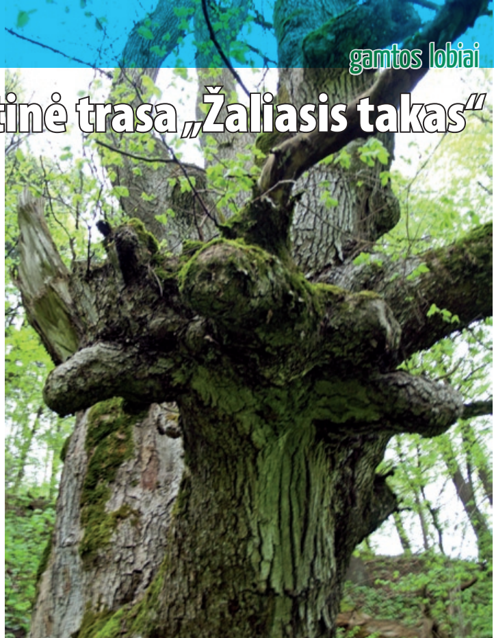
Reliktinis sengirės medis

Spindžiaus kraštovaizdžio draustinyje galite pamatyti net 26 augalų rūšis, įrašytas į Lietuvos raudonąją knygą, ir 4 augalų